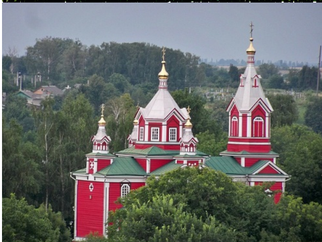
Церква Святої Катерини в селі Дубівка, 1905 рік