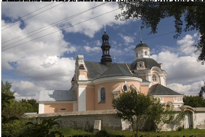
https://www.youtube.com/watch?v=g39a34pa108 - церква Святої Катерини в селі Дубівка, 1905 рік